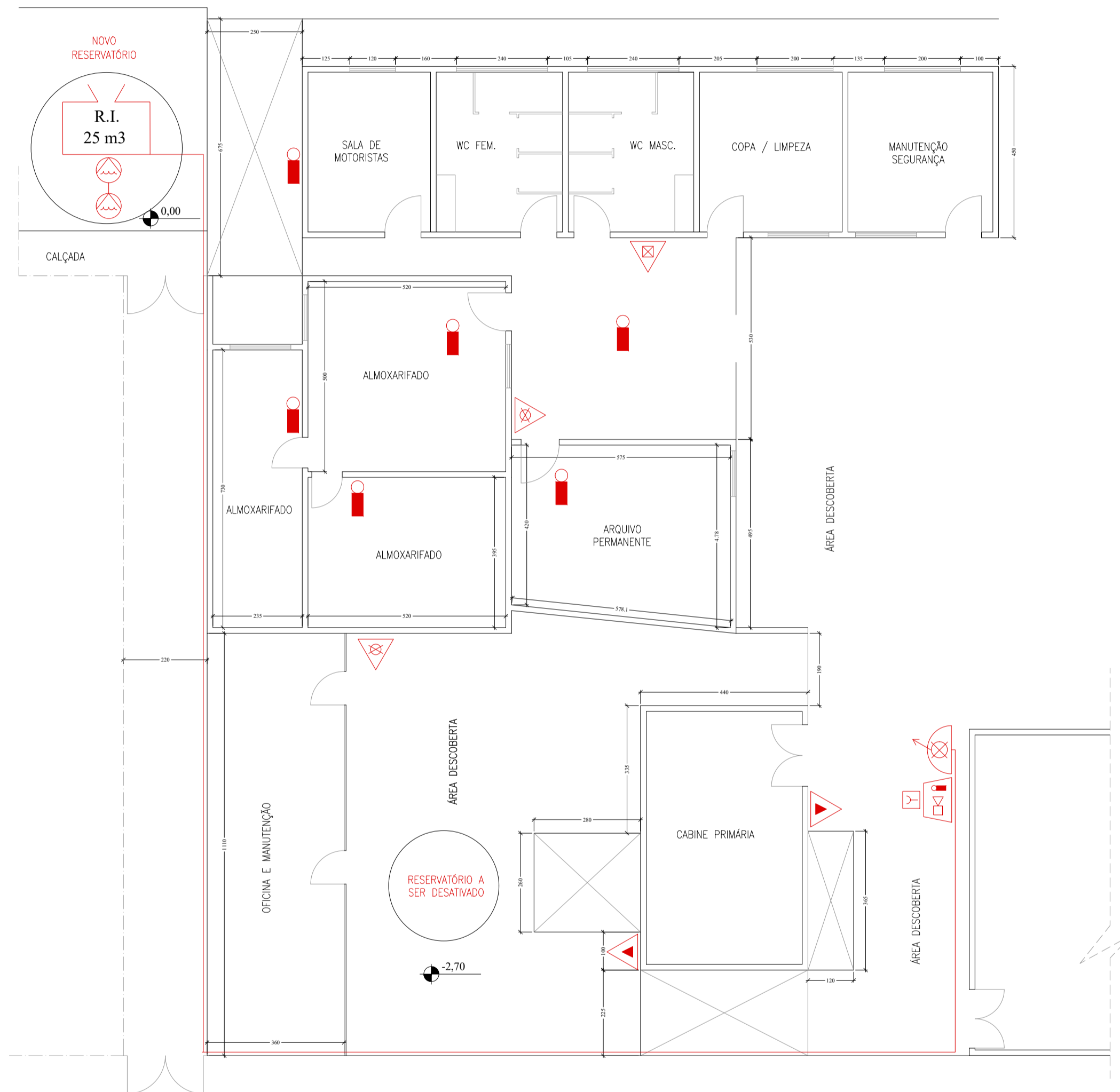
PLANTA BAIXA ESCALA 1:100